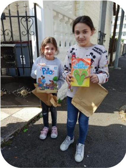
Des petites filles de Bondy heureuses de leurs nouvelles lectures