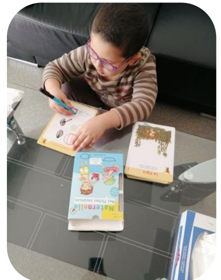
On apprend à la maison comme à l'école

« Les parents et leurs enfants sont venus à l'école maternelle de Torigné et des livres leur ont été prêtés... cela crée du lien avec les familles et permet d'enrichir la continuité pédagogique autour du livre »