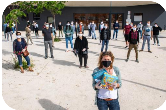
Les volontaires ayant participé à la distribution des livres à La Seyne sur Mer