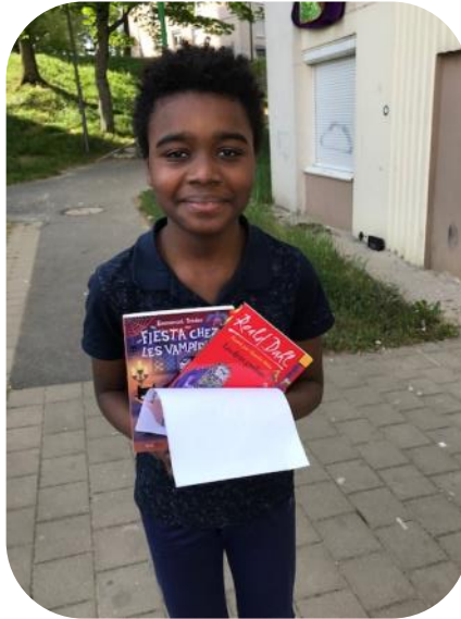
Un jeune enfant de la Cité éducative de la Ronde Couture à Charleville Mézières