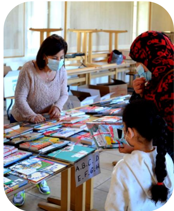
Une remise de livres dans le respect des règles sanitaires dans la ville de Grigny

Nous tenons à remercier tout spécialement notre partenaire logistique, la société Microlynx basée à Rennes, qui, malgré des effectifs réduits en ces circonstances, s'est mobilisée pour préparer rapidement et efficacement les lots de livres destinés aux Cités éducatives.