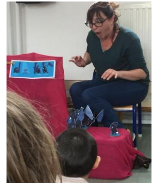
@Théâtre de la mer

« Les livres sont choisis en concertation entre la conteuse (moi) et les professeurs de maternelle en fonction des thèmes qu'ils sont en train de travailler ou de la période de l'année. 2 livres sont choisis par semaine. Ils sont lus par tranche d'une demi-heure par classe. Ensuite, je lis ces histoires en théâtralisant ma lecture. Nous avons établi un petit rituel avant de commencer la lecture et ils s'y prêtent volontiers ! Je m'aide d'accessoires, d'images, je joue les personnages. La lecture terminée, nous discutons ensuite avec les enfants sur le thème de l'histoire. Pour la soupe aux cailloux, j'avais apporté de vrais légumes : poireaux, choux, céleri, carottes, navets et courgettes. Beaucoup d'enfants découvraient pour la première fois ces légumes quand d'autres me faisaient la remarque que la courgette n'était pas un légume d'hiver !!! les enfants primo-arrivants ne connaissant pas la langue, rien tout de même devant les histoires. Un véritable lien s'est établi avec eux et tous leurs visages s'illuminent lors de la lecture !