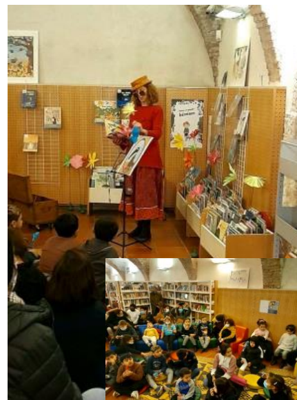
@ En Paren(th)èse

Projet partenarial coconstruit avec La MPT Panier – Joliette, Le Centre Social Bausseque, l'association Petitapeti, En Paren(th)èse..., les jardiniers du Panier et la Bibliothèque du Panier