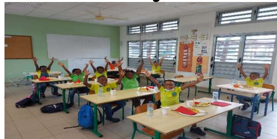
Ecole élémentaire Alexis Delacroix