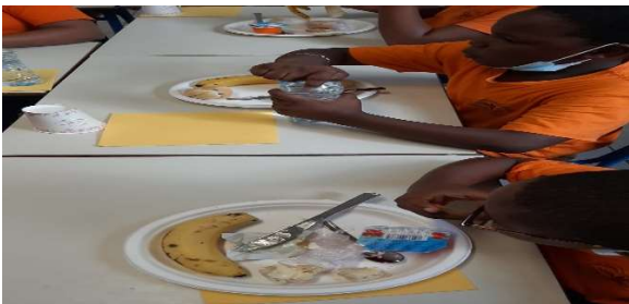
Ecole élémentaire de Bananier