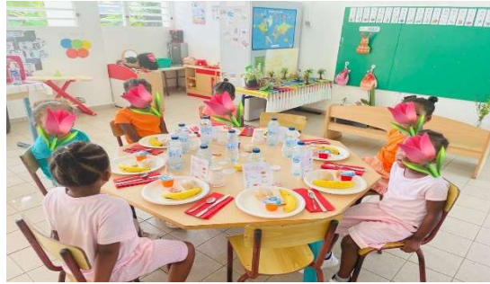
Ecole maternelle Jlet Péron