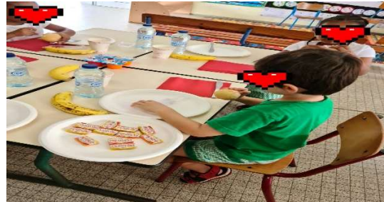
Ecole maternelle Gérard Lauriette