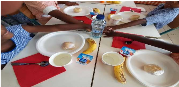
Ecole maternelle de sarlasonne