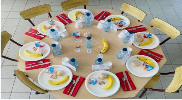
Quel festin !!!