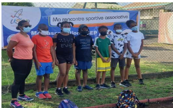
Bay balan senwobè