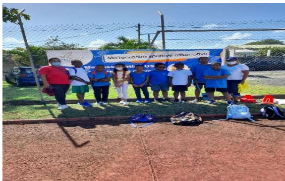
Ti moun Routyé