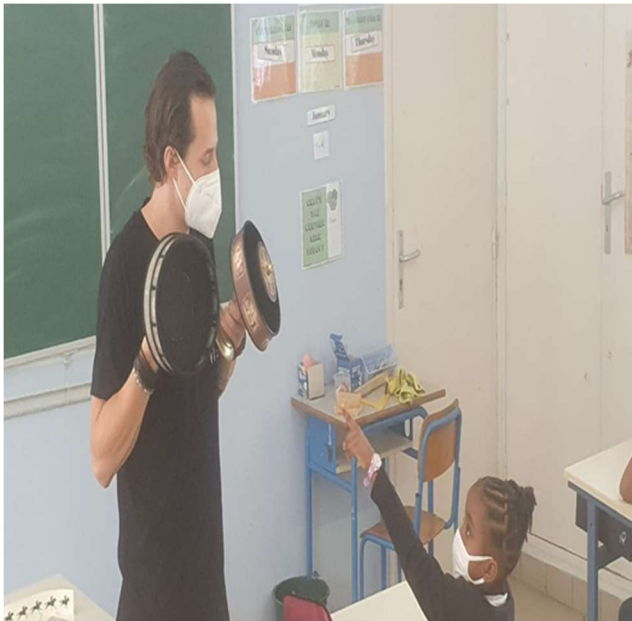
Présentation du zootrope et du praxinoscope