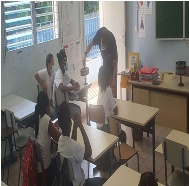
Manipulation du praxinoscope