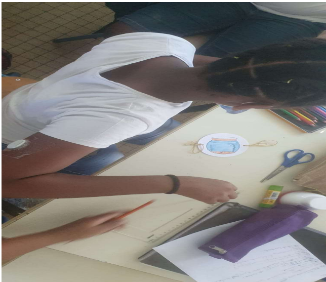
Fabrication d'un thaumatrope