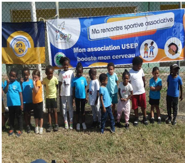
Ti moun Routyé