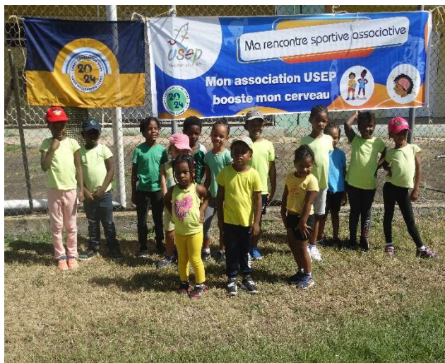
Bay balan senwobè