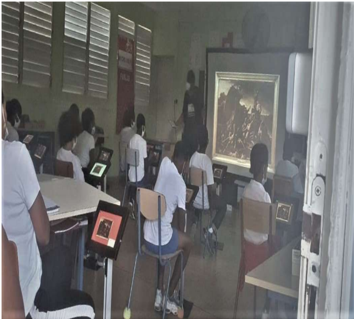
Découverte du « Radeau de la méduse »