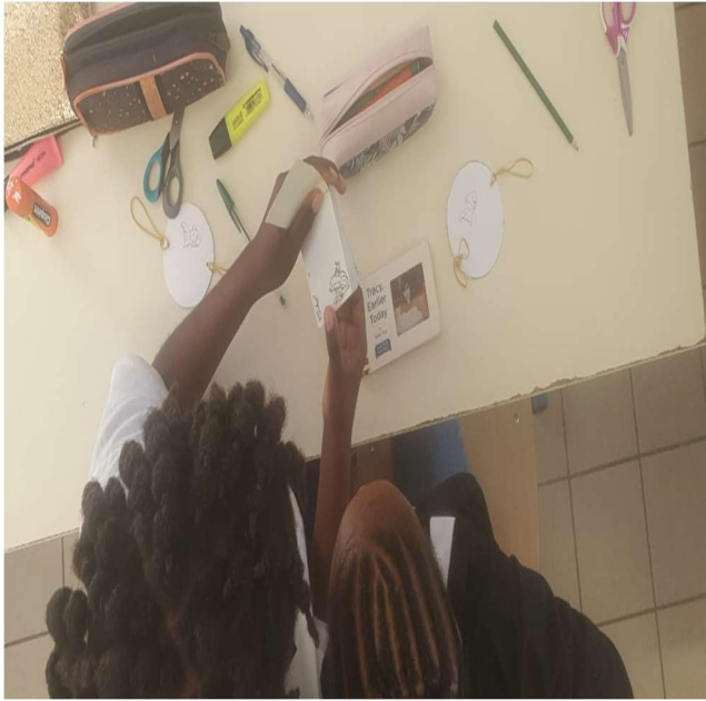
Présentation d'un folioscope