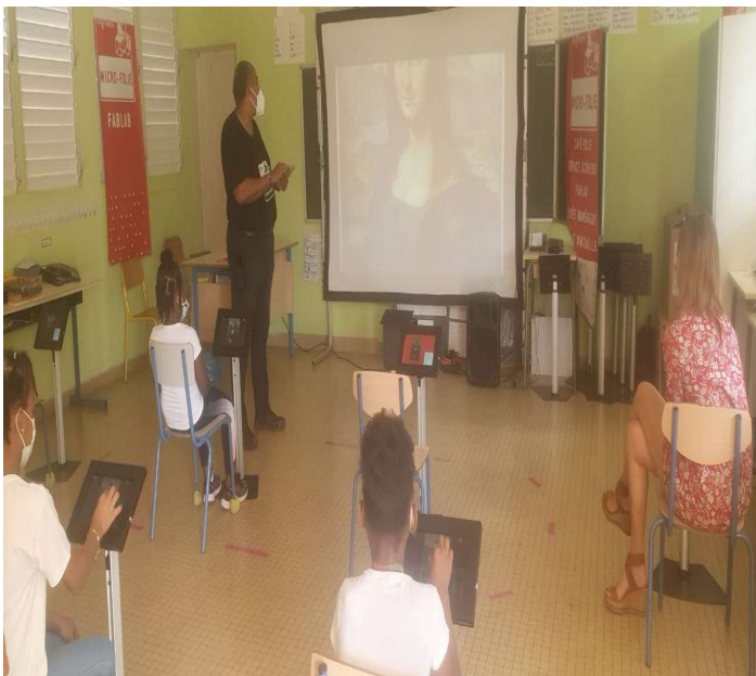
Découverte de « La Joconde »