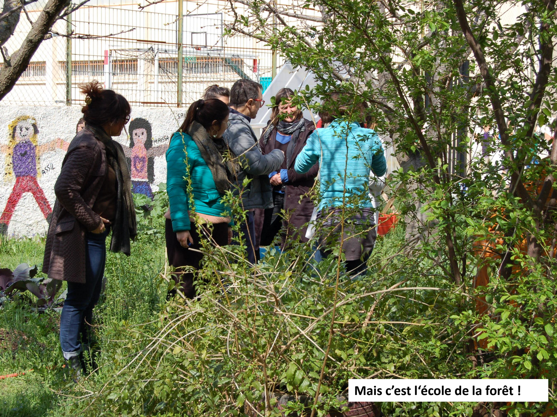
Mais c'est l'école de la forêt !