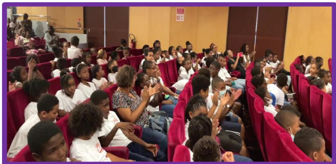
Le public conquis