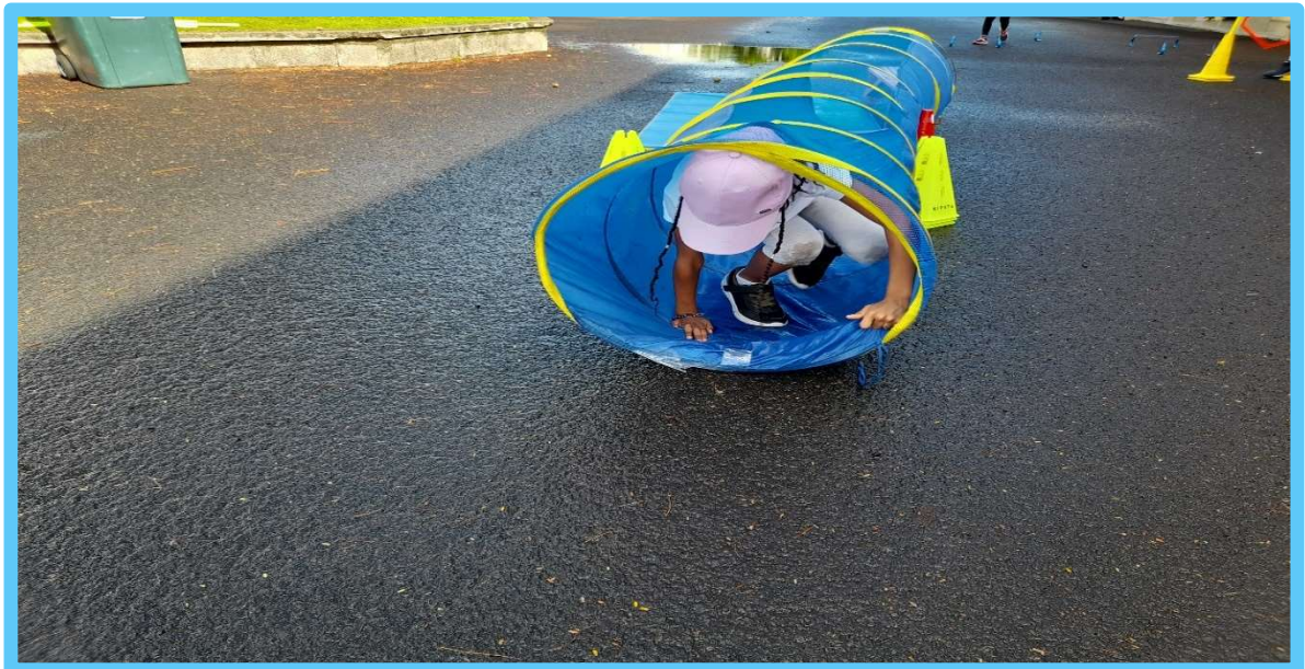
Le passage difficile du tunnel du parcours militaire