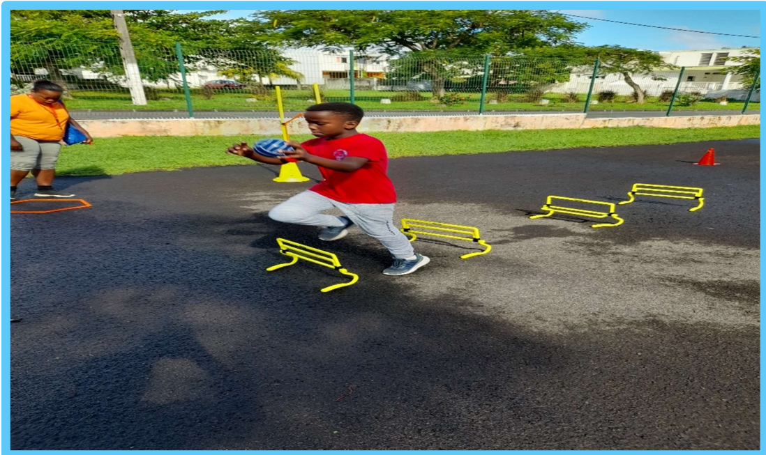
Un jeune athlète en plein effort !