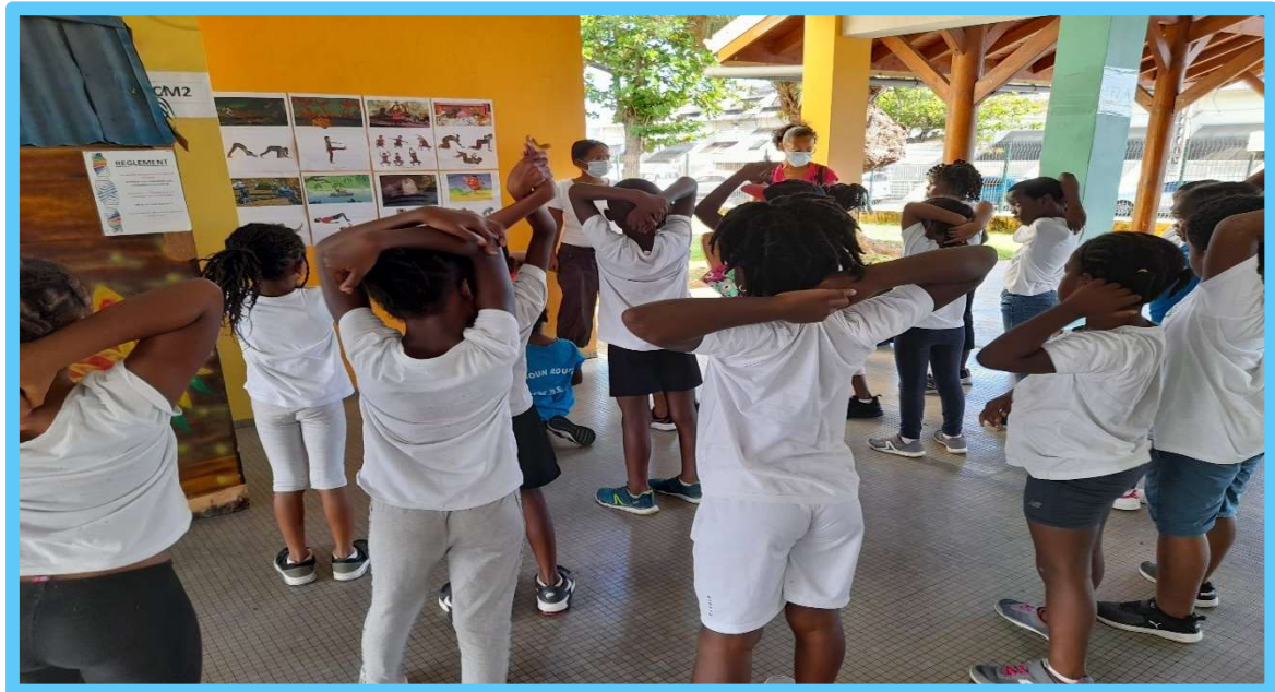
La gymnastique des animaux