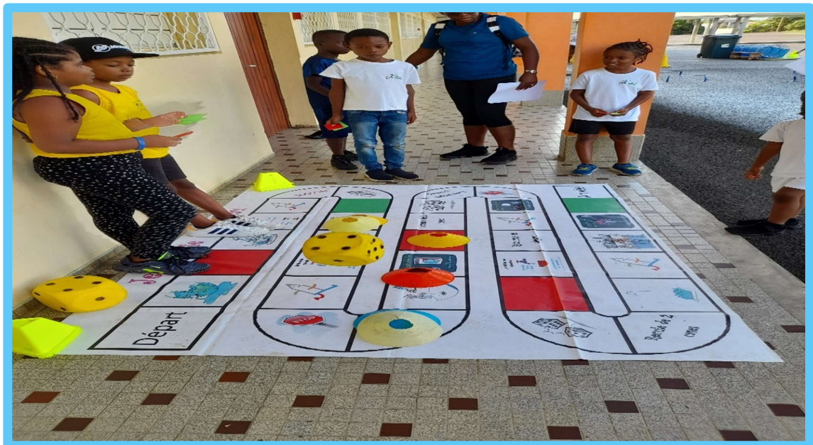
Le jeu de l'oie sur l'eau